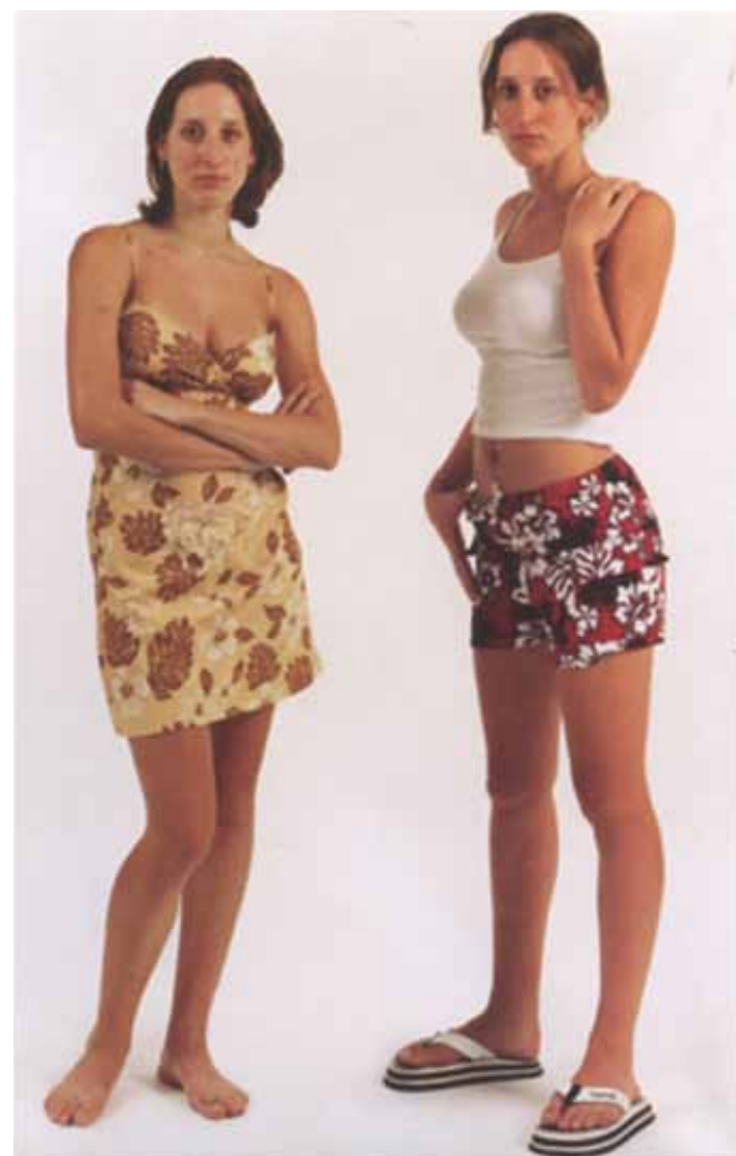
LYNN HUGHES, SOMEWHAT SINFUL/METRICAL SYSTEMS #2, (DETAIL)