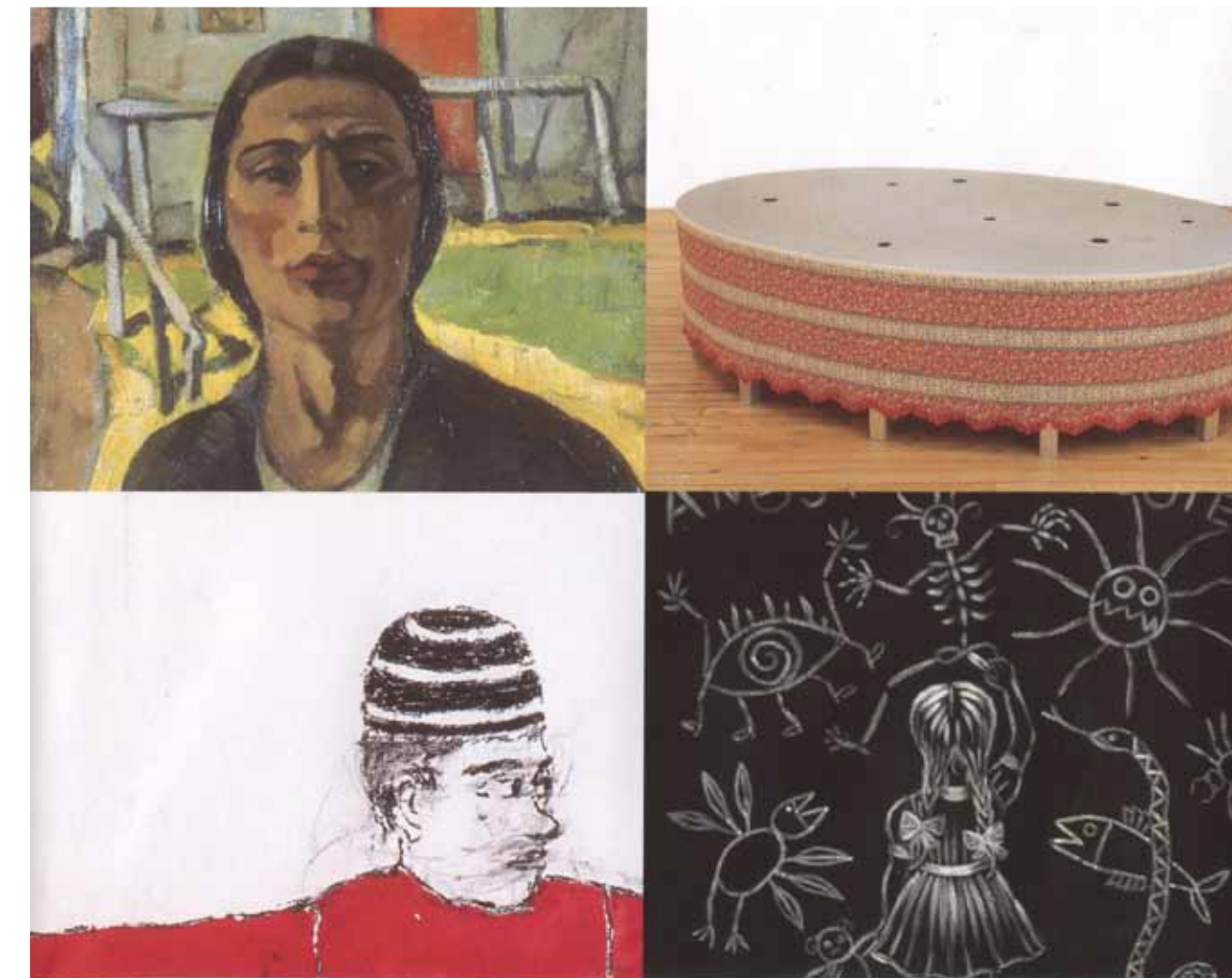
EVA BRANDL, VALSE (LES TROUS DE CIEL) (DETAIL) KATJA KESSIN, 2001 EARTH OESBY (DETAIL)